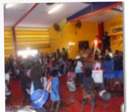
DIE NEUEN TANZTALENTE