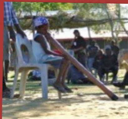
DER JÜNGSTE TEILNEHMER AM WETTBEWERB IN BARUNGA, BEI DEM DER BESTE DIDGERIDOO SPIELER GEKÜRT WIRD